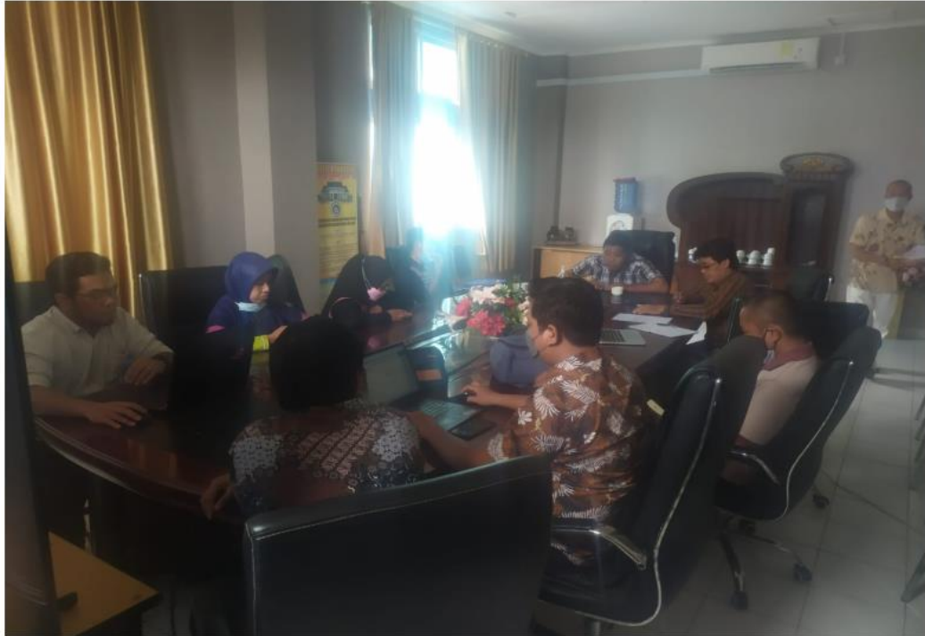
Lampiran 1. Foto

Sekretariat Senat: Gedung Dekanat FISIP Lantai 2 Telp.(0771) 4500090; Fax.(0771) 4500091. PO.BOX 155-Tanjungpinang 29100